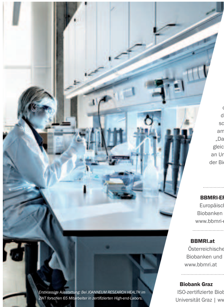
Erstklassige Ausstattung: Bei JOANNEUM RESEARCH HEALTH im ZWT forschen 65 Mitarbeiter in zertifizierten High-end-Labors.